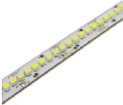
YUKON 22 W